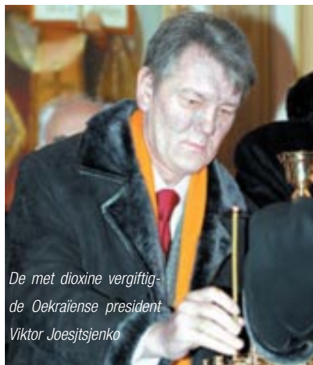
De met dioxine vergiftigde Oekraïense president Viktor Joesjtsjenko

Voor meer informatie over de door BDS ontwikkelde methode, zie www.biodetectionsystems.com .