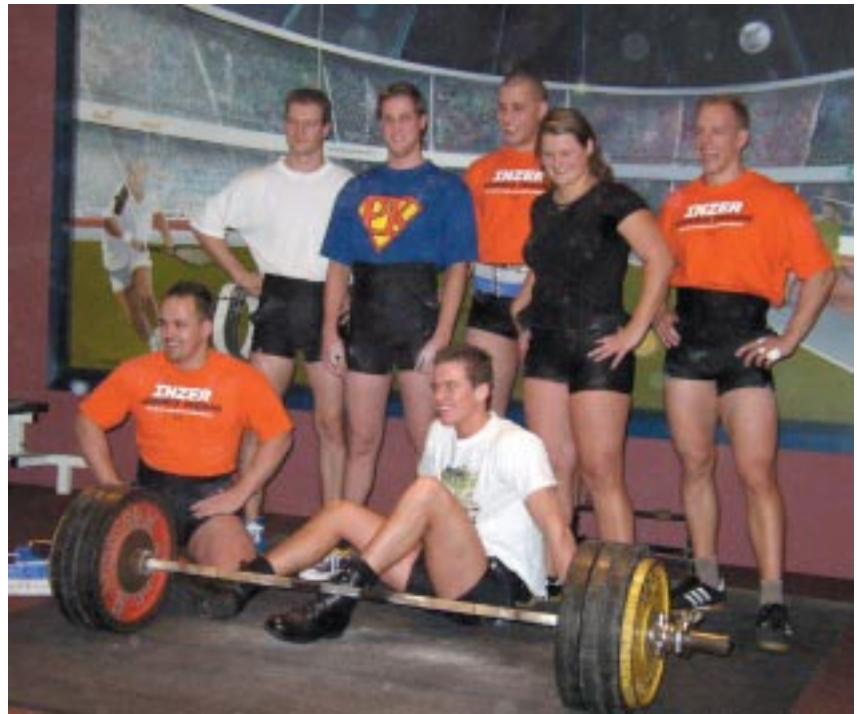
Alle Pure Kracht deelnemers na de succesvolle finale