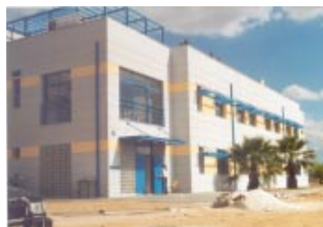
Het dopinglaboratorium in Athene telde een record aantal Olympische positieven