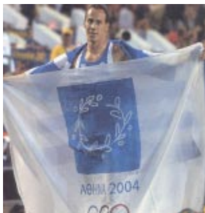
Kostas Kenteris maakt reclame voor de Olympische Spelen in Athene

Valsspelers en foute coaches een halt toegeroepen zonder positieve plas