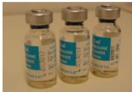
Nandrolon met verschillende stempels

Toch vinden ook de meeste gebruikers dat er te veel doping wordt gebruikt in Nederland. Ook deze groep stelt dan ook maatregelen voor die de gezondheidsschade als gevolg van dopinggebruik moeten minimaliseren. Veel gebruikers pleiten voor vrijgave van enkele, in hun ogen relatief veilige, dopingmiddelen. Ook zouden zij graag gebruik willen maken van een testfaciliteit, waarbij de echtheid van middelen die zij willen gebruiken (over het algemeen anabole steroïden) bepaald kan worden. Gezien de gezondheidsrisico's van de middelen zelf die altijd gepaard zullen gaan met gebruik, lijken deze suggesties vooralsnog geen goede oplossing. Het is waarschijn-