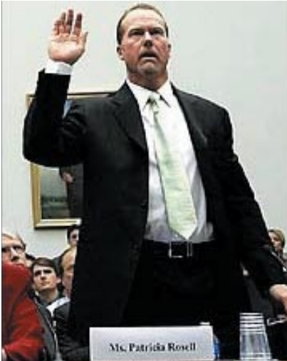
Mark McGwire in de rechtzaal

Recentelijk stond het Amerikaans congres bol van de doping. Aanleiding vormde het steroïdegebruik in de in Amerika zo geliefde baseball sport. Voormalig topspeler Jose Canseco gaf met zijn boek "Juiced" een kijkje in de keuken van het dopinggebruik in deze sport. Canseco die zichzelf "the chemist" noemt, is er van overtuigd dat "The challenge is not to find a top player who has used steroids. The challenge is to find a top player who hasn't". Andere topspelers zoals Sammy Sosa en Mark McGwire, die werden opgeroepen om te getuigen, ontkenden echter in alle stelligheid. Een andere topspeler, Barry Bonds, moest helaas verstek laten gaan vanwege een gerechtelijk vooronderzoek in de BALCO dopingzaak, de vermeende producent van THG. Amerikaanse congresleden repten over het slechte voorbeeld dat de Amerikaanse topsporters stelden voor de jeugd waarvan er reeds 500.000 steroïden gebruiken. Grote sportbazen, zoals Bud Selig, getuigden daarentegen dat het anti-dopingbeleid van baseballers met een sanctie van 10 dagen voor dopinggebruik "is as good as any in professional sports". Daartegenover stond het verdriet van ouders die hun kinderen hadden verloren als gevolg van het gebruik van steroïden. De soap was compleet. Maar in een land waar de president zelf voorzitter is geweest van een baseball club en de gouverneur van California (A. Schwarzenegger) in zijn puber-