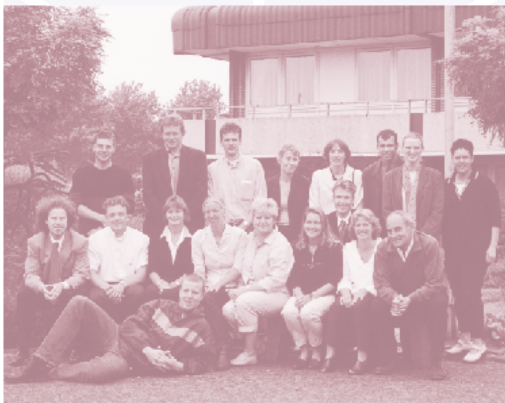
Nieuwe lichten dopingcontrole-officials met docenten, klas september 2000

Dopingcontrole-officials zijn diegenen die door wind en weer de plasjes verzamelen van de sporters. Voordat de dopingcontrole-officials op pad mogen, dienen ze eerst de NeCeDo-opleiding 'dopingcontrole-official' succesvol afgerond te hebben, want dopingcontrole-official word je niet zomaar. Je dient als dopingcontrole-official namelijk te beschikken over een aantal vaardigheden, zoals het nauwkeurig kunnen omgaan met procedures en met vertrouwelijke informatie. Tevens dien je goed om te kunnen gaan met mensen alsmede goed te kunnen communiceren.